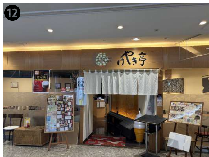
到着です。 スタッフ一同、心よりお待ちしております。