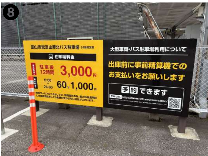
乗降場前の横断歩道(約20m)を渡ると、 ビルが見えてきます。