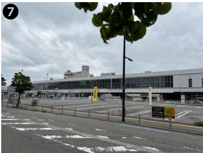
乗降場の隣には大型バス駐車場も ございます。(有料・16台可)